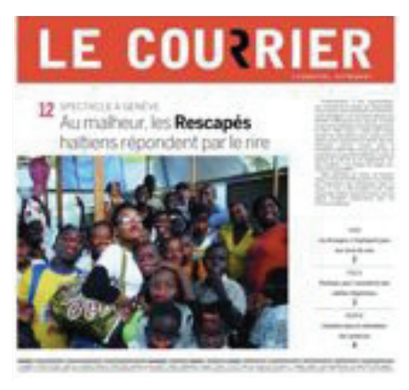
Article du quotidien suisse Le Courrier avec une photo de la troupe en une du journal. (03.08.2011)