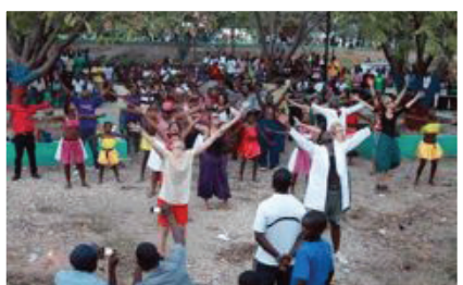
Flash mob et théâtre de rue à Mais Gâté, Port-au-Prince (03.08.2012)