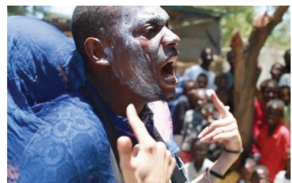
Théâtre Kapouchnik à Port-au-Prince (11.07.2012)