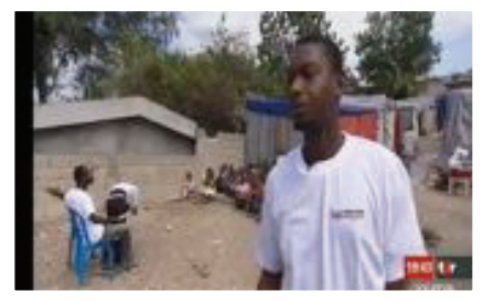
Reportage du TJ de la Télévision Suisse Romande sur Les Rescapés (12 mars 2010)