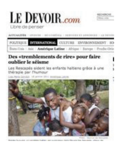
Article du quotidien canadien Le Devoir sur les Rescapés (18.01.2011)