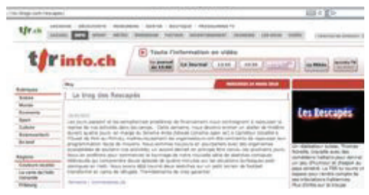
Blog des Rescapés sur le site de La Télévision Suisse Romande (24.03.2010)