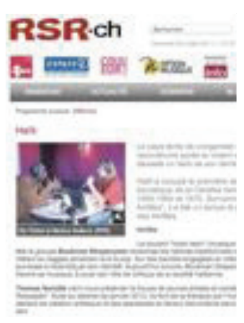
Les Rescapés sur La Radio Suisse Romande dans le cadre de l'émission Bleu Caraïbes (24.07.2011)