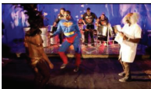
Animations de Supermoun et Dr Toutiste (Les Rescapés) au Paleo Festival de Nyon (19.07.2011)