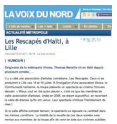
Article du quotidien français La Voix du Nord sur Les Rescapés à l'occasion de leur passage à Lille (13.07.2011)