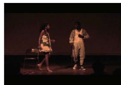
Spectacle de sketches burlesques au Vicomte, Port-au-Prince (20.10.2007)