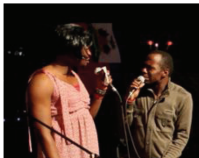
Stand-up Comedy au Théâtre La Parfumerie à Genève (03.08.2011)