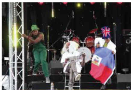
Sketch burlesque sur la Grande Scène des Fêtes de Genève (04.08..2011)