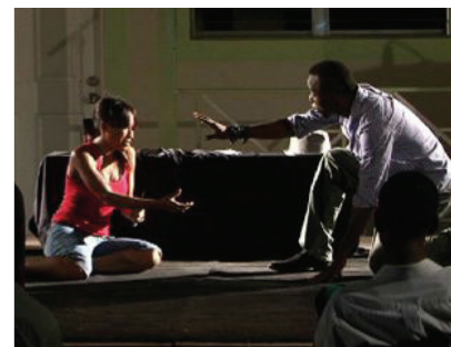
Théâtre forum sur la violence sexuelle à l'Institut Français d'Haïti (13.09.2012)