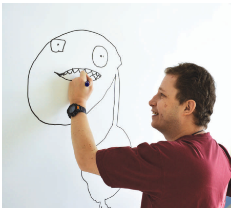
Ci-dessus l'artiste en pleine inspiration pour le démarrage de «Paradis» . A droite l'œuvre achevée.