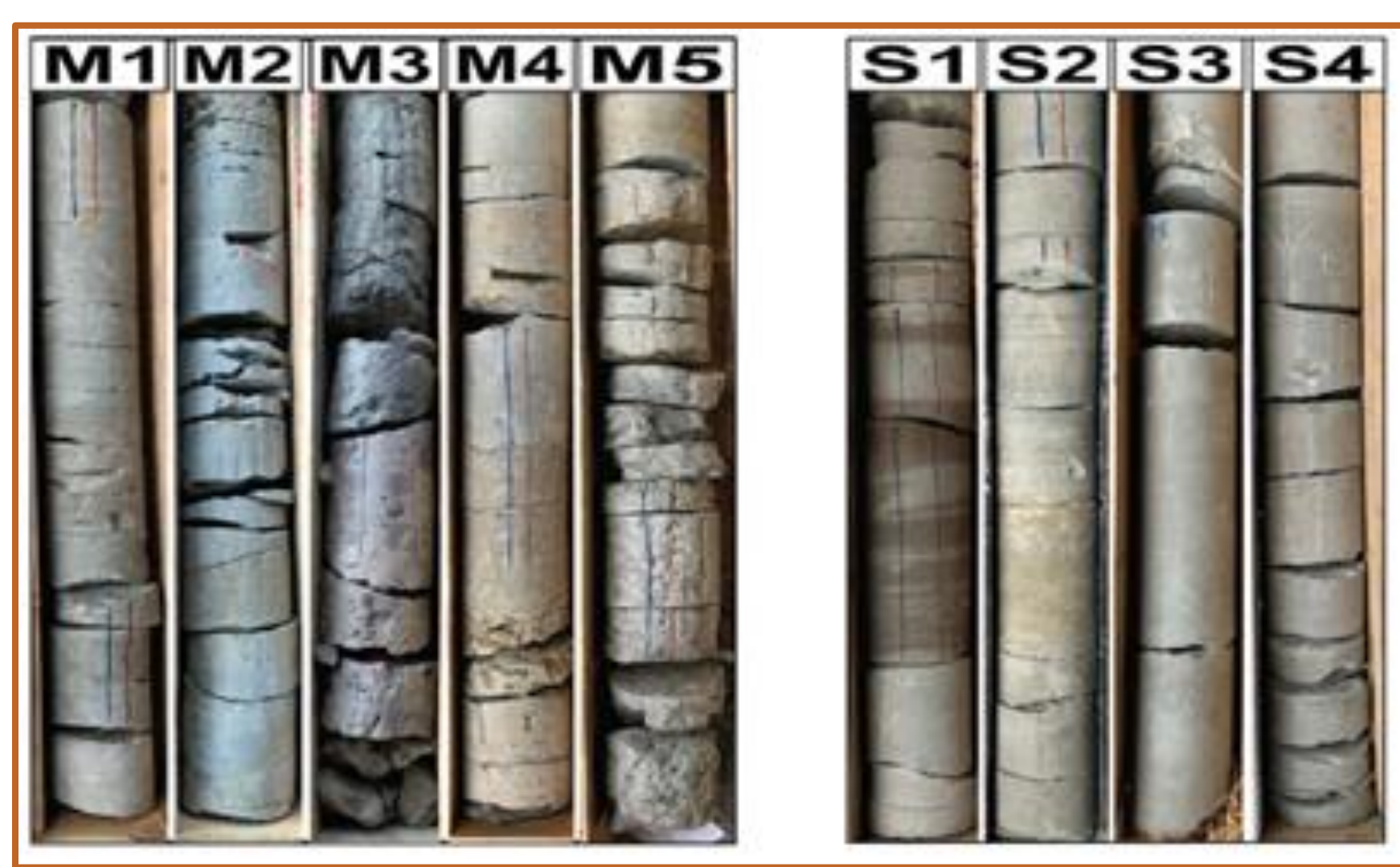
Lithotypes de molasse rouge le long de l'alignement du tunnel (Haas & Moscardello 2022)