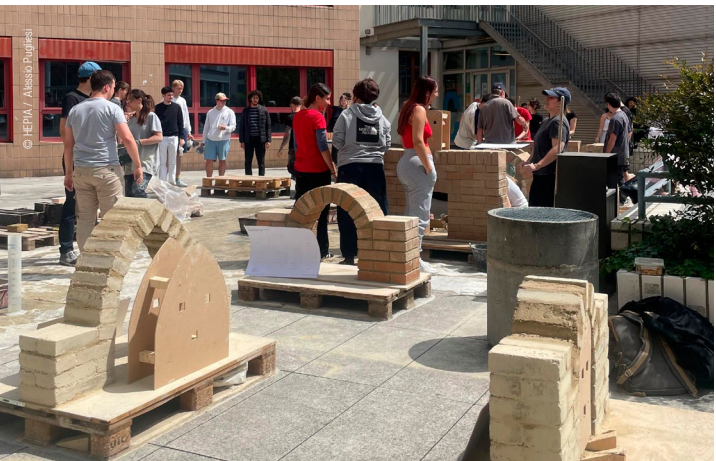
Quartiers en chantier : Présentations des projets d'atelier de 2 e année à la Ville de Genève