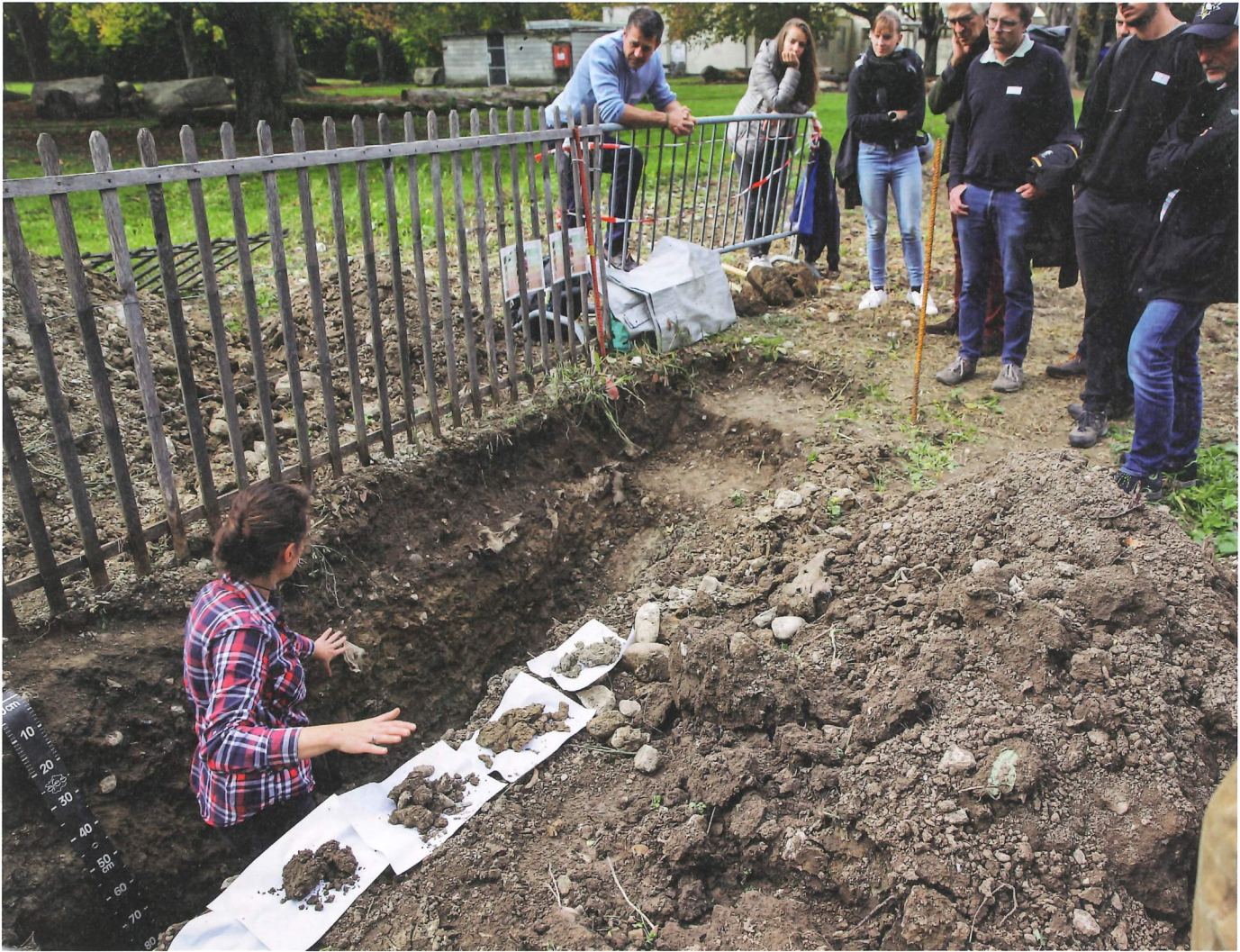
Démonstration pratique de recherche et de cartographie d'un sol avec les échantillons des composants spécifiques aux différentes strates.