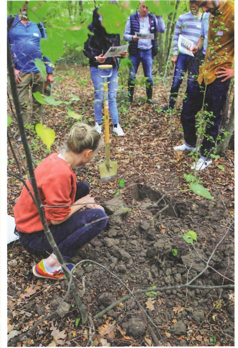
A gauche: Les ateliers pratiques ont permis aux participants de comprendre l'enjeu des mouvements de terre et le stockage en vue de la valorisation sur site.