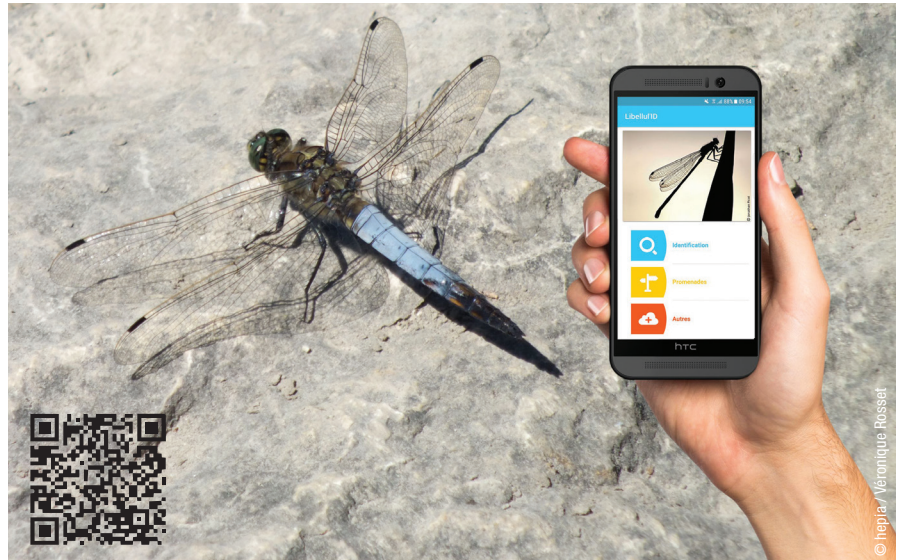
L'application Libellul'ID en action

L'objectif de ce projet est de faire découvrir les libellules au grand public . Nous avons développé une application smartphone gratuite permettant de découvrir et d'identifier les espèces principales de libellules de Suisse romande. Grâce à cette application, le public peut disposer en permanence d'un outil d'identification simple et ludique et peut agrémenter ses promenades à l'aide d'informations sur les libellules.