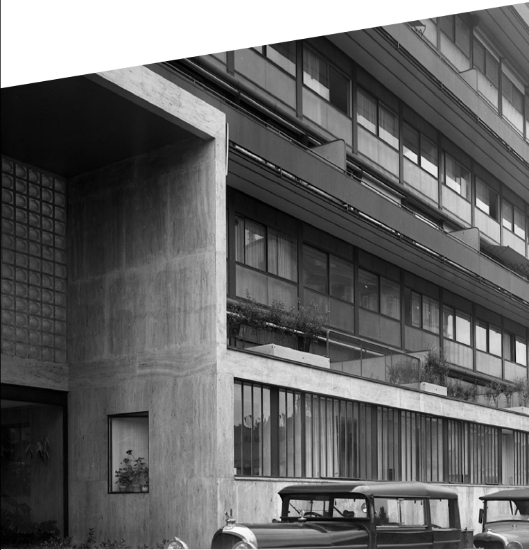
Immeuble Clarté, Genève