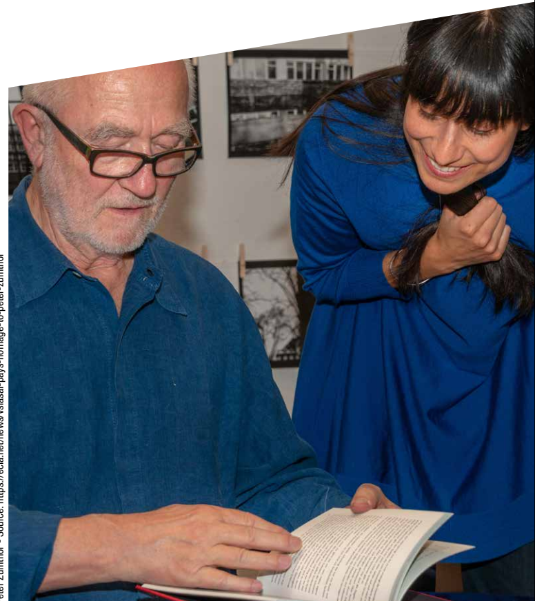
Peter Zimthor