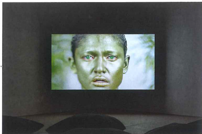
Korakrit Arunanondchai, with history in a room filled with people with funny names 4 , 2017. Digital video still.