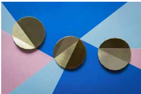
Ophélie Sanga, 800-1000 gr , 2016, trois broches, laiton brossé plaqué or