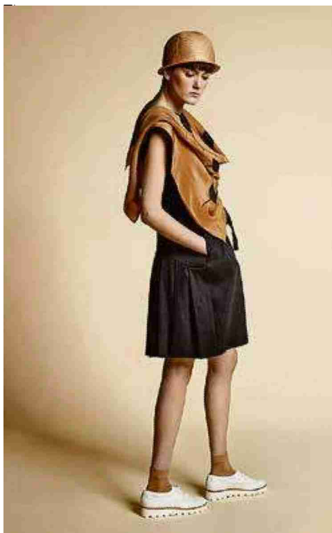
Une garçonne de la collection «Horizon» par Atelier Laure Paschoud. (ATELIER LAURE PASCHOUD)

Pour être sélectionné au Swiss Fashion Point, il faut respecter trois critères: avoir au moins une année d'existence, produire en Suisse et vendre ses pièces «histoire d'éviter d'avoir une exposition de prototypes», continue Vanessa Hambaryan, qui constate le nouvel intérêt pour le vêtement masculin. «La mode intéresse de plus en plus les hommes. Ils sont sensibles au détail, au savoir-faire.» Même si en Suisse, il y a toujours peu de garçons pour les habiller. «Les femmes en revanche s'y mettent. La mode masculine made in Swiss a un vrai potentiel, surtout en ce qui concerne les accessoires et la maroquinerie.» ■ PAR EMMANUEL GRANDJEAN @ManuGrandj