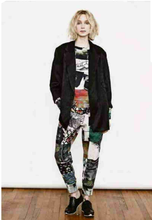
Imprimés colorés chez Berenik. (BERENIK)