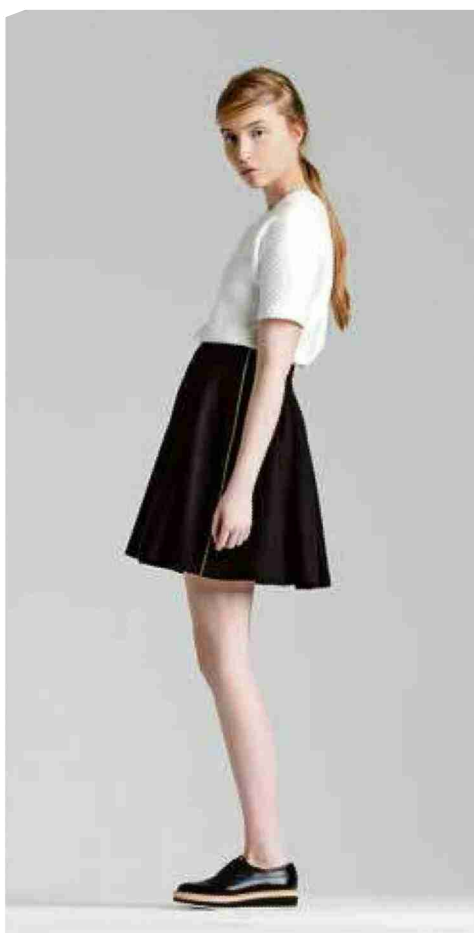
Silhouette géométrique chic par Pascale Cornu. (PASCALE CORNU)

N° de thème: 375.009 N° d'abonnement: 1073023 Page: 31 Surface: 173'137 mm 2