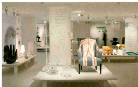
L'espace ReGeneration, Body House, conçu par François Bernard pour Maison&Objet.

Mardi 8 novembre à partir de 9h30, à la HEAD, Genève. Programme complet et inscriptions à partir du 30 septembre sur espacescontemporains.ch Réservé aux professionnels de la branche, nombre de places limité.