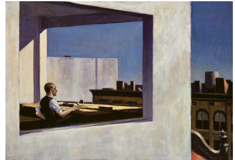
L'omniprésence de l'extérieur au sein de l'espace intérieur: Edward Hopper, Office in a Small City (1953)

Cette réflexion sera centrée autour de trois questionnements. Tout d'abord, il s'agira de situer l'invention de l'intériorité en partant de sa spatialisation (caverne, cavité, chambre, espace protégé) chez Platon, Saint-Augustin, ou encore Descartes. Ensuite, sera discuté l'essor de l'espace intime comme conquête majeure de la bourgeoisie aboutissant à la maxime de « A Room of One's Own ». Enfin, tenteront d'être identifiées les modifications du concept d'intériorité confronté à la relativité des lignes de démarcation intérieur/extérieur et de l'essor de systèmes rhizomatiques.