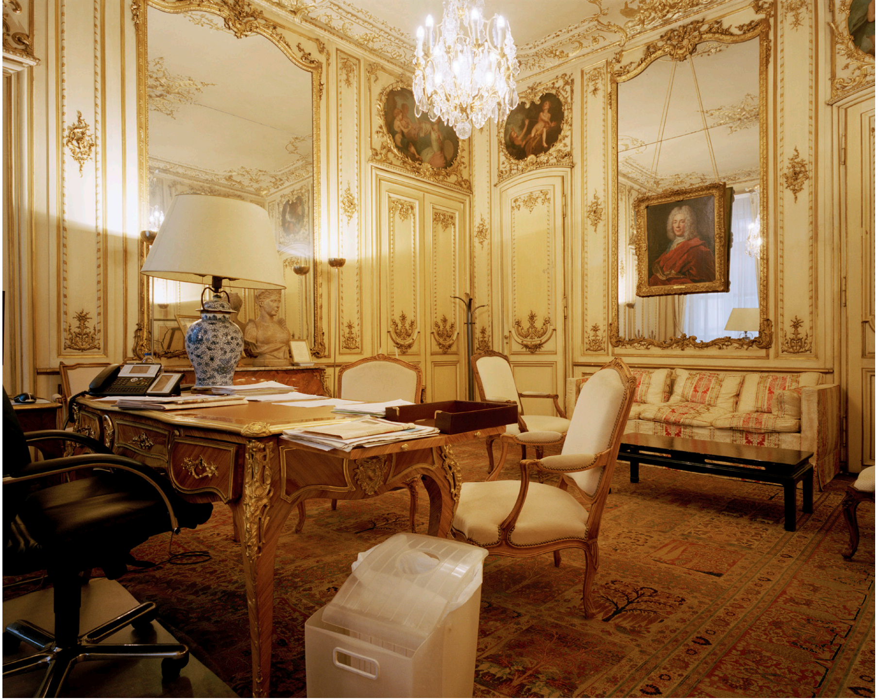
Armin Linke BNP Paribas, headquarters, Napoleon's wedding room Paris France 2012