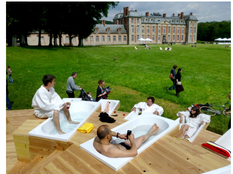
Bruit du frigo, Chamarrande-les-bains, Domaine de Chamarrande (91), 2013

Si le développement des projets démocratiques est un enjeu de nos sociétés, alors de nouvelles formes d'urbanités restent à inventer. Un nombre croissant d'individus devrait trouver les possibilités d'avoir prise sur la fabrique permanente du monde où l'on vit.