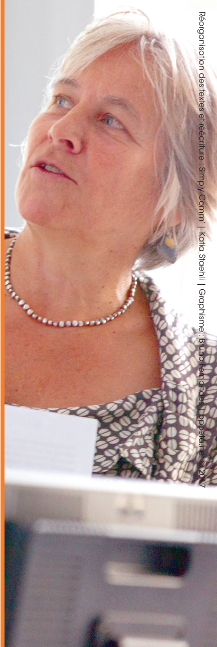
Régionalisation des textes et réécriture : Simply Comm | Katia Staehli | Graphisme : Bruno Fendriani | 11 pages | mai 2017