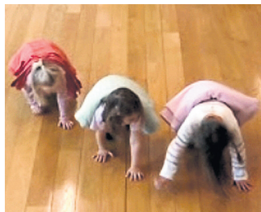
Exemple de séance de psychomotricité avec des enfants. CERIP

Dans le cadre du Master en Psychomotricité de la HETS, les étudiantes et étudiants sont sur leur lieu de stage plusieurs heures par semaine. En plus de cette alternance, la pratique du métier s'invite dans les cours, à l'image du partenariat mis en place avec une crèche genevoise. Des séances de psychomotricité sont ainsi proposées à des groupes d'enfants de 3 à 4 ans. «Ce cours est très représentatif de l'intervention psychomotrice dans la petite enfance: animation de séance, observation du développement psychomoteur puis échange de pratiques pour mieux accompagner les enfants», relève Délia Danesin-Démarest, maître d'enseignement. La préparation a lieu en classe, puis la séance est animée par deux étudiants et encadrée par une enseignante. Plusieurs points d'attention sont examinés: organisation dans l'espace, posture, transitions, etc. Les séances sont filmées et suivies par les autres étudiants qui travaillent sur des grilles d'observation. Le matériel pédagogique ainsi obtenu permet de partager des outils d'observation et de prévention. Une méthodologie applaudie par l'étudiante Valentine Burkhalter: «Élaborer la séance en groupe, puis observer ses effets ainsi que la dynamique vécue au moyen d'extraits vidéo est une expérience hautement formatrice.» (AB)