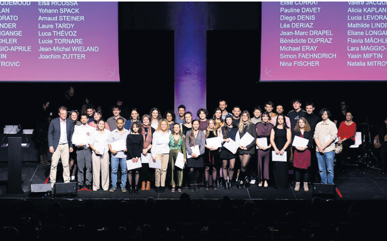
HEPIA a célébré la réussite de ses 282 diplômées et diplômés le 21 novembre 2025 au Cube.