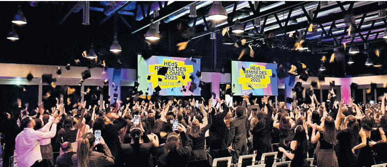
Lancé de chapeaux de bachelier à la fin de la cérémonie de remise des diplômes Bachelor de la Haute école de santé.