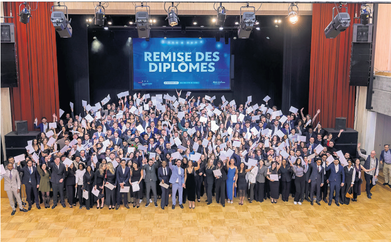
Les 331 diplômées et diplômés de la HEG lors de la cérémonie du 27 novembre à la Salle des Fêtes de Thônex.