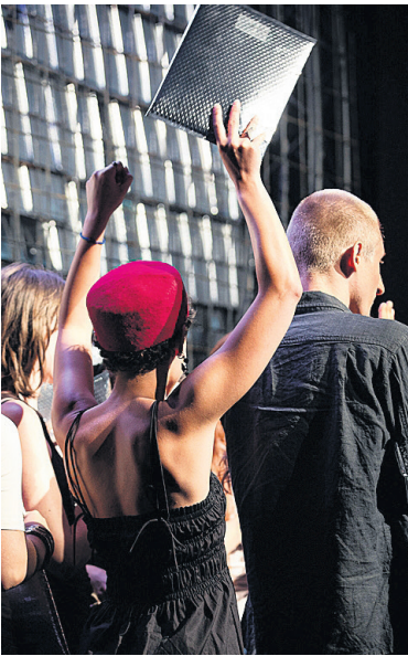
251 jeunes artistes et designers ont fêté leurs diplômes en juin lors de la remise des diplômes de la HEAD.