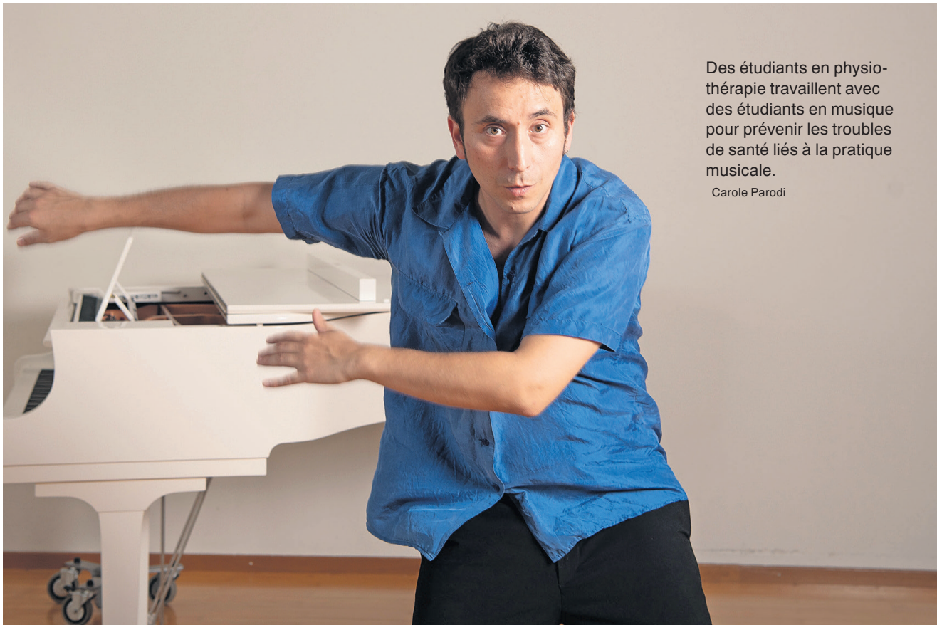
Des étudiants en physiothérapie travaillent avec des étudiants en musique pour prévenir les troubles de santé liés à la pratique musicale.

À HEPIA, l'interdisciplinarité est au cœur des métiers de l'ingénierie, de l'architecture et du paysage. «Les projets reproduisent les situations professionnelles réelles, notamment la collaboration entre disciplines», explique Malena Bas-