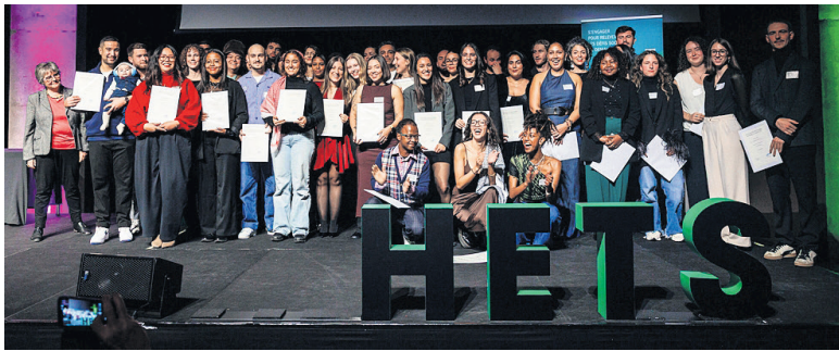
La HETS a fêté ses 217 diplômées et diplômés au Cube.