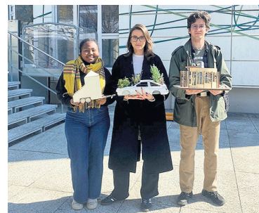
Trois des quatre membres de l'équipe ayant proposé des «anomalies urbaines» pour interpellier les passants.

Grâce à une boîte à outils méthodologique, les étudiants apprennent à poser un diagnostic sur un quartier, à analyser les besoins des acteurs, à concevoir un projet de manière collaborative et à le communiquer. Chaque équipe présente ensuite son travail au jury du Prix Créagir, qui remet chaque année un financement permettant la pour-