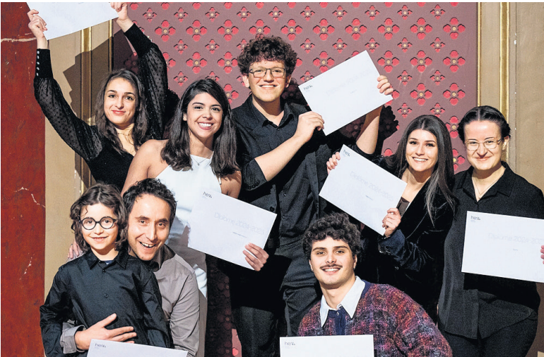
La joie des diplômées et diplômés de la HEM qui ont célébré leur diplôme le 25 novembre au Victoria Hall.