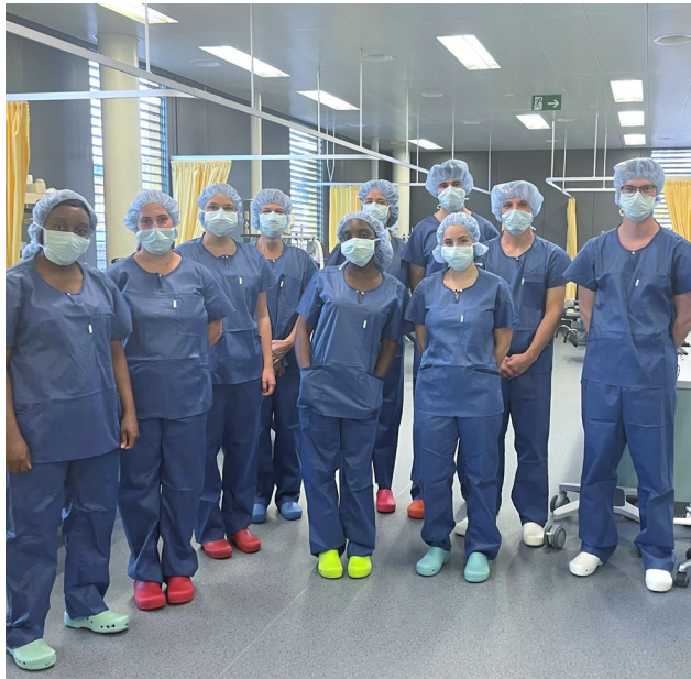
Visite aux Etablissements hospitaliers du nord vaudois (eHnv), Yverdon

... et des visites immersives , directement sur le terrain !