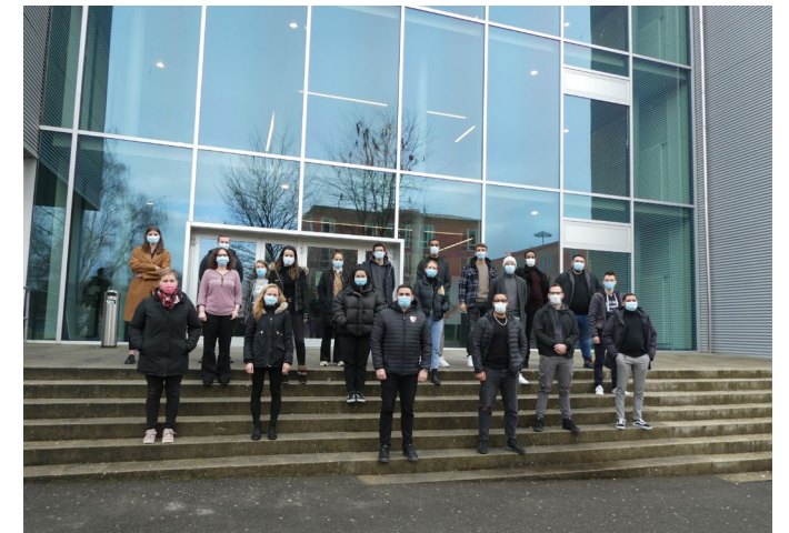
1 ère volée de l'option, 2020-2021