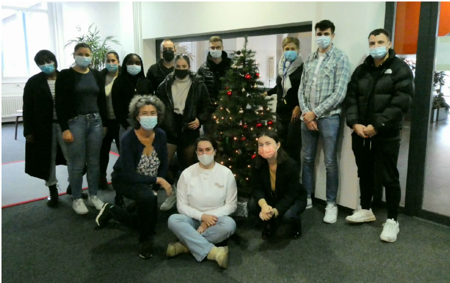
Volée actuelle de l'option, 2021-2022