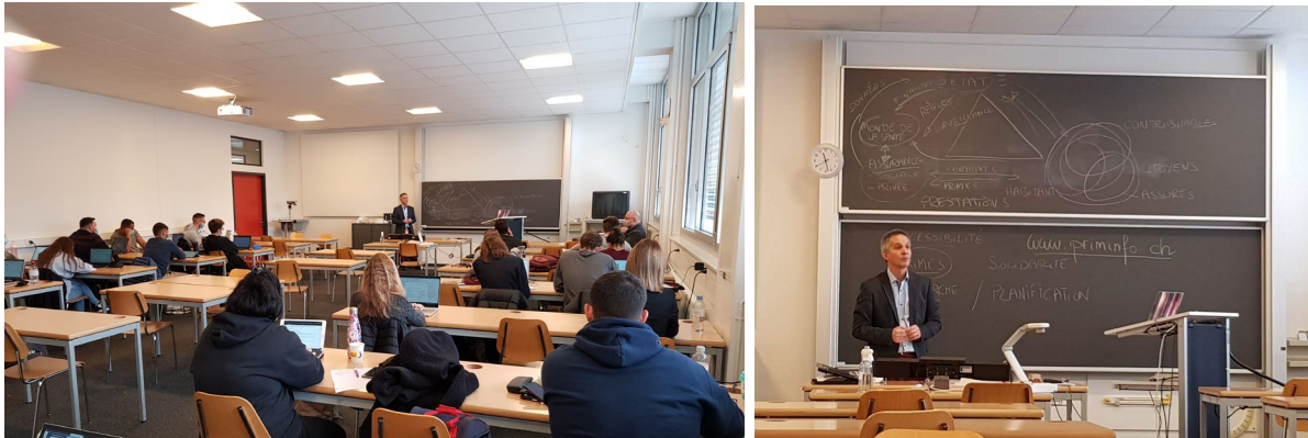
Intervention de SantéSuisse, Association faîtière des assureurs-maladie suisses