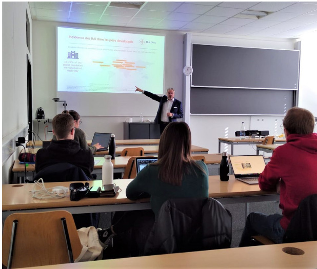
Présentation du case study 1

... grâce à 2 case studies , directement amenés par des professionnels du terrain !